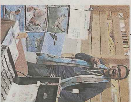
■ Accueil chaleureux avec les adolescents de l'Keop de Bellesaigne, à l'entrée de la Foire de Lozère.

de mariée, mobilier... Et pour les visiteurs, ils peuvent faire des devis sur place, c'est pratique. On a aussi pensé aux enfants avec des jeux proposés par « Chouette ».