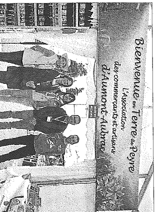
Accueil par les commerçants aumonnais dès l'entrée.

CAROLINE GAILLARD cgallard@midi Libre.com